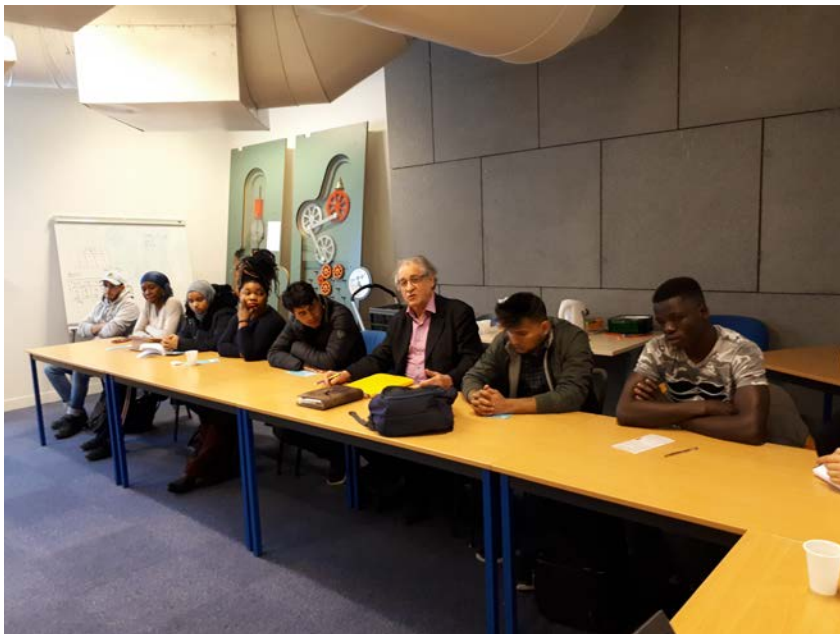
séminaire auprès des publics migrant

Le profil des participants était très divers - des professionnels qui travaillent avec les migrants au sein d'ONGs, un chargé d'études à l'OCDE qui travaille sur la migration et la diversité, des représentants de la Cité des Métiers (participant à d'autres projets européens Univercience et des responsables du label international) Ils ont été convaincus par l'approche MigrAID et par les productions intellectuelles présentées. En particulier la formation sera très utile pour leur pratique professionnelle. L'approche de la diversité est un sujet transversal qui est lié aux domaines de tous les participants.