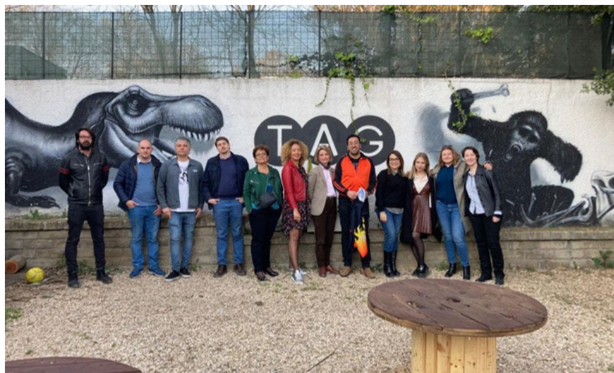
Preparando el evento del 25 de marzo de 2022 en TAG - todos los socios, ROMA